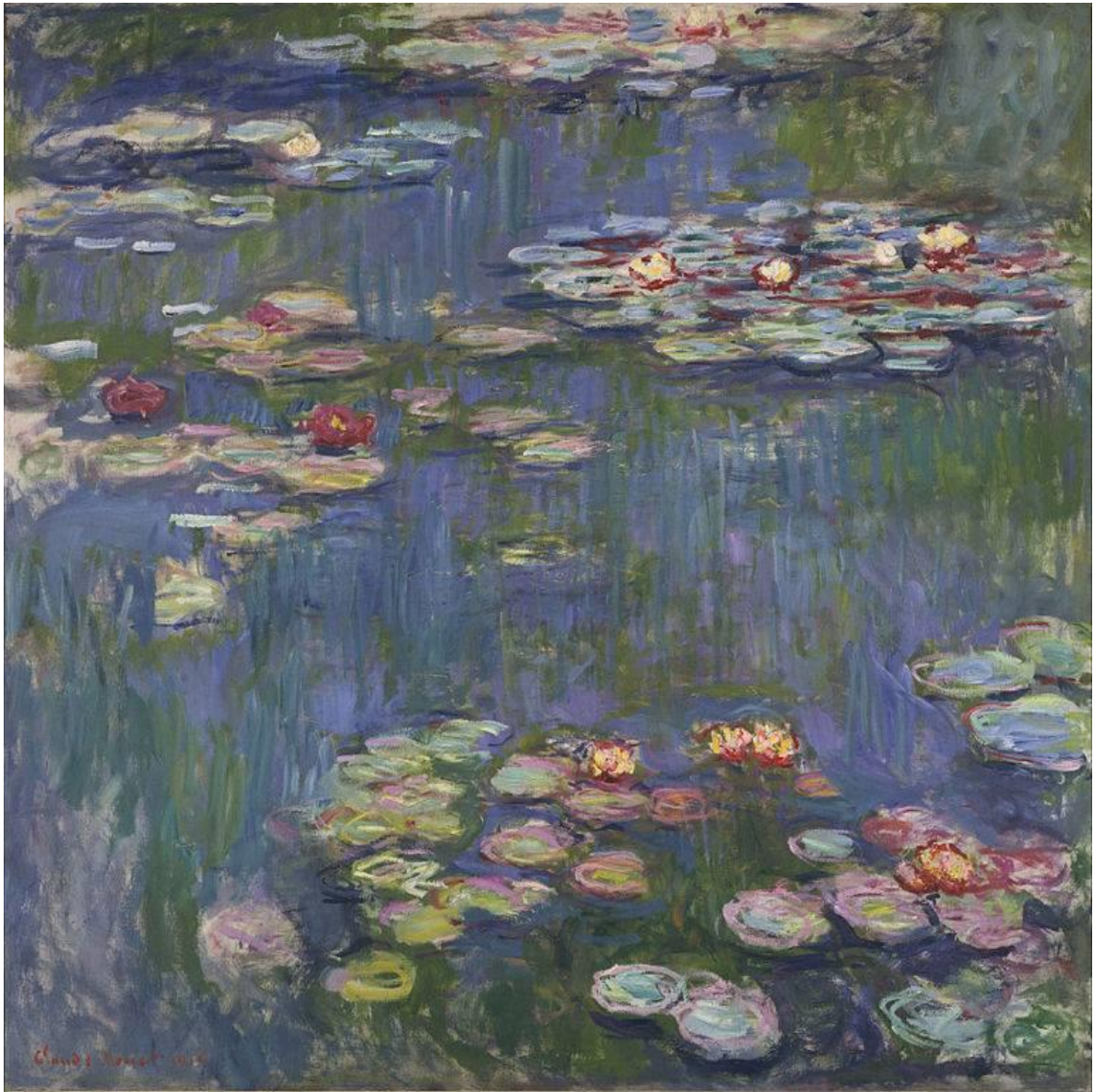
クロード・モネ 「睡蓮」 1916 年 油彩/キャンバス 200.5 x 201 cm 国立西洋美術館（日本）